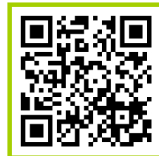
퇴직공제제도 교육 동영상